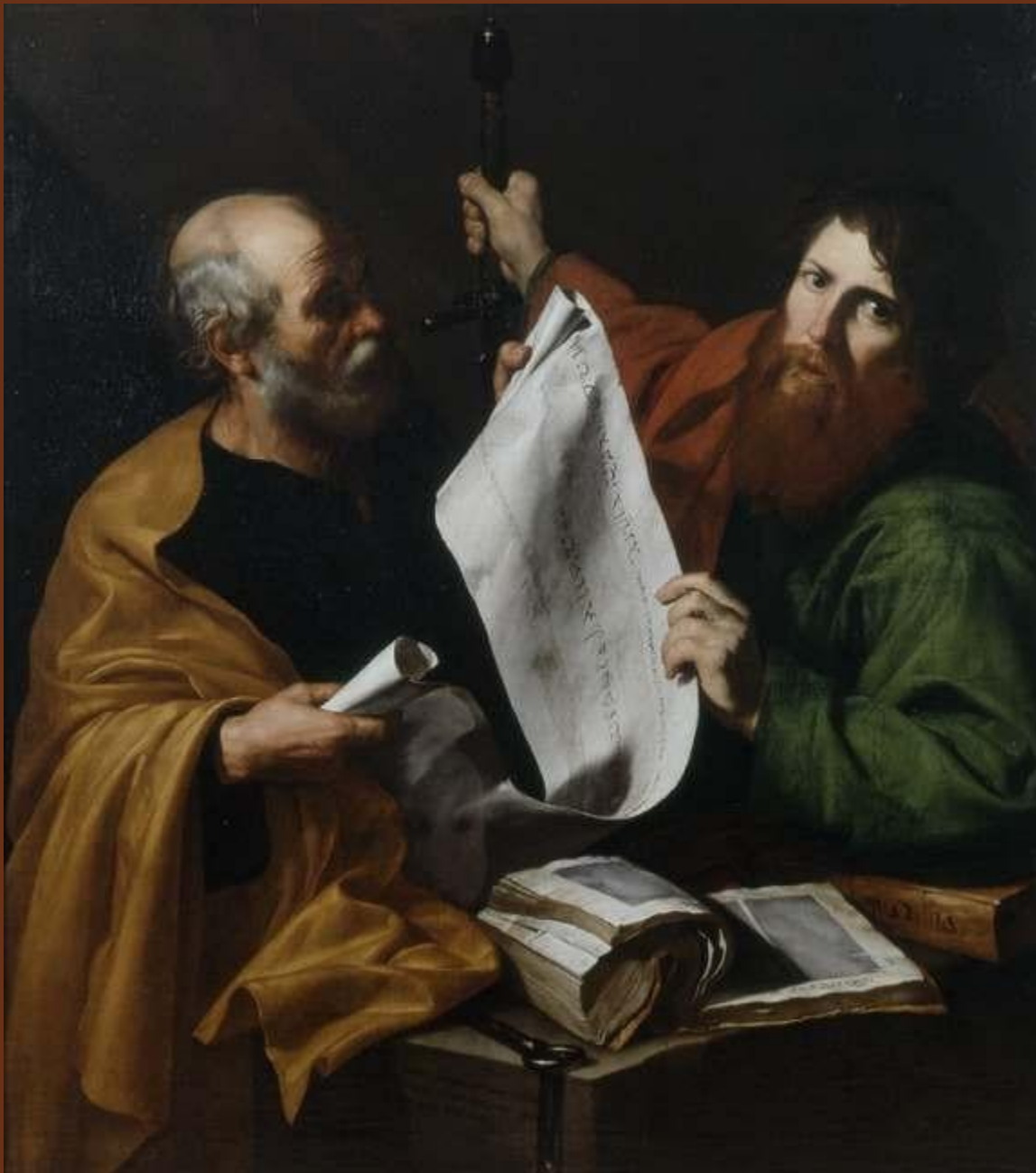
Shën Pjetri dhe Pauli nga Jusepe de Ribera ©. 1616)

KRYEDIOQEZA METROPOLITANE SHKODËR - PULT Nr.5/6, Maj - Qershor 2024