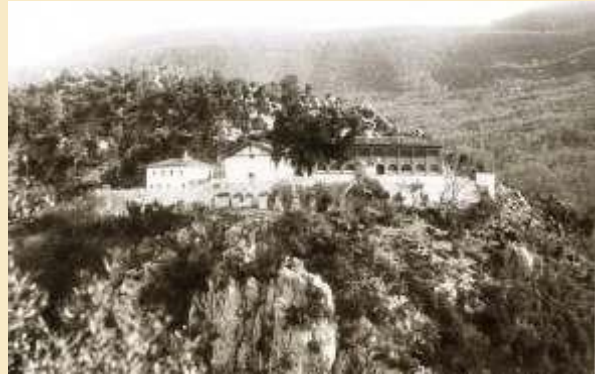
Manastiri fotografuar nga kodra ku ruhen muret e fortifikimit antiko-mesjetar të Sebastës, Monument Kulture , Kategoria I. Marubi, fillim shek. XX

Pasi viziton Kishën, shumë zbresin në “Shpellën e Shën Vlashit Martir” por ka të tjerë pelegrinë që i luten shenjtit kur ndalojnë tek vendi i qirinjve. Kisha përfaqëson, në historinë e para viteve '91, një nga hapësirat më të martirizuara sepse aty mijëra lutje të dala nga zemra ju drejtuan meshtarit për ndihmë.