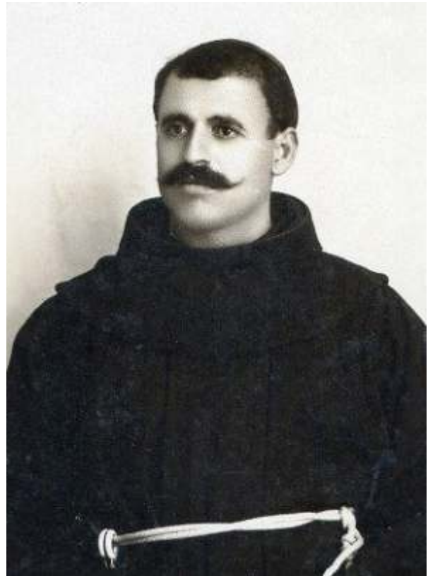
Atë Luigj Palić (Paliq)

SHËNIM: Shpallja e lumturimit të lexohet në të gjitha meshat e së dielës, me 4 gusht 2024.