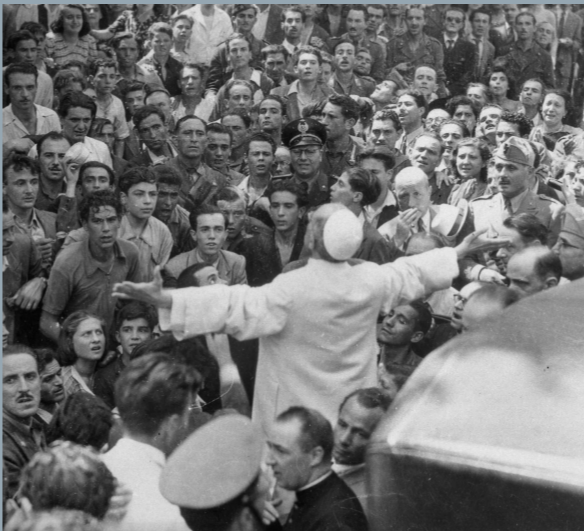
Papa Piu XII

KRYEDIOQEZA METROPOLITANE SHKODËR - PULT