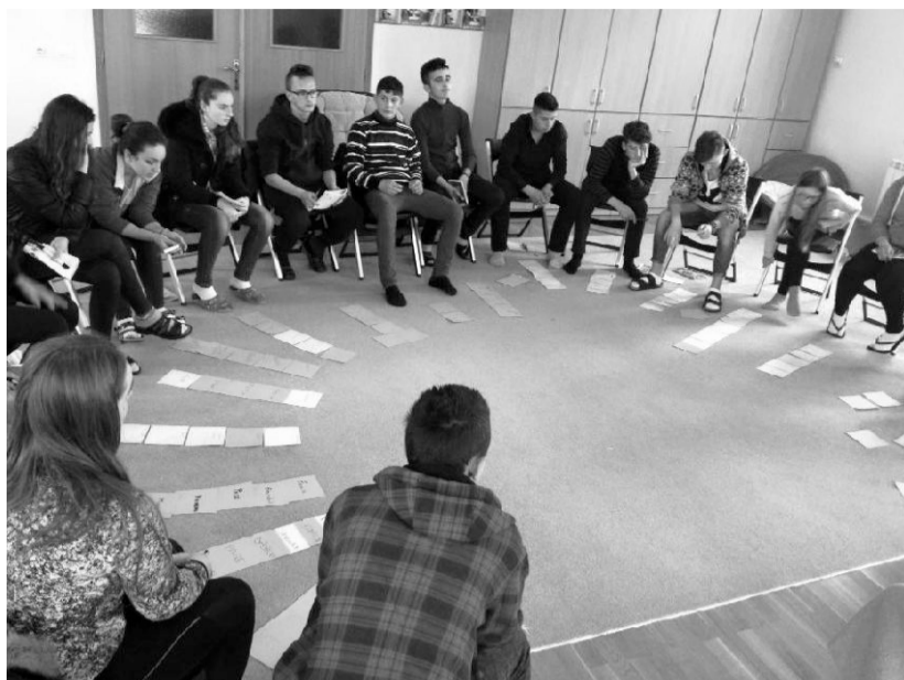
Të vihesh në shërbim të të rinjve është një kantjer I hapur

Të punosh me të rinjtë dhe për të rinjtë, sot më shumë se kurrë, është një sfidë dhe një prioritet. Në Dioqezën tonë, falë bashkëpunimit dhe përgaditjes së shumë personave, janë përcjellë shumë nisma dhe aktivitete në favor të të rinjve. Puna me të rinjtë është e dashur prej të gjithëve, pasi jemi të vetëdijshëm se janë pasuria më e shtrenjtë për Kishën dhe për shoqërinë. Mbi shpatullat e tyre, mbartet e ardhmja e një vendi, e ardhmja e familjeve të shëndosha, e ardhmja e një klase drejtuese, në këtë mënyrë lista mund të tejzgjatet pafund.