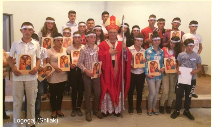
... Logegaj (Shllak)