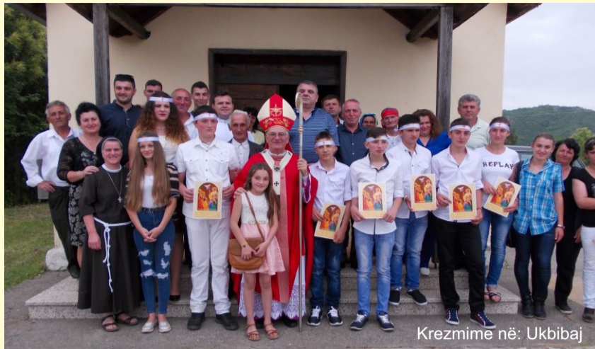
Krezmime në: Ukbibaj